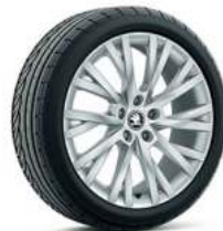
רמת גימור Style 18"