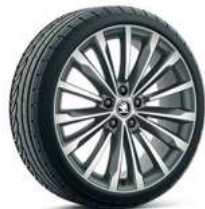
רמת גימור L&K 19"